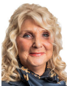
Jolanda Broere Makelaar o.z.

Als lokale experts kennen wij de regio Leiden van binnen en buiten. U kunt bij ons terecht voor al uw vragen en advies met betrekking tot onroerend goed. Wij zijn een servicegerichte organisatie en ondersteunen u bij elke stap van het transactieproces. Van tips om uw huis verkoopklaar te maken tot aan het verzorgen van een naamplaatje voor de nieuwe eigenaar van uw woning. Onze beroemde slogan luidt: "Niemand in de wereld verkoopt meer onroerend goed dan RE/MAX." Laat ons u overtuigen.