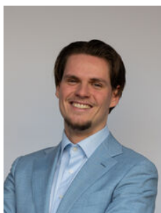
Yme Koevoet Makelaar o.z.

Als lokale experts kennen wij de regio Leiden van binnen en buiten. U kunt bij ons terecht voor al uw vragen en advies met betrekking tot onroerend goed. Wij zijn een servicegerichte organisatie en ondersteunen u bij elke stap van het transactieproces. Van tips om uw huis verkoopklaar te maken tot aan het verzorgen van een naamplaatje voor de nieuwe eigenaar van uw woning. Onze beroemde slogan luidt: "Niemand in de wereld verkoopt meer onroerend goed dan RE/MAX." Laat ons u overtuigen.