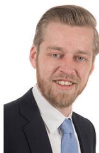
René Wetsteijn Makelaar o.z.

Als lokale experts kennen wij de regio Leiden van binnen en buiten. U kunt bij ons terecht voor al uw vragen en advies met betrekking tot onroerend goed. Wij zijn een servicegerichte organisatie en ondersteunen u bij elke stap van het transactieproces. Van tips om uw huis verkoopklaar te maken tot aan het verzorgen van een naamplaatje voor de nieuwe eigenaar van uw woning. Onze beroemde slogan luidt: "Niemand in de wereld verkoopt meer onroerend goed dan RE/MAX." Laat ons u overtuigen.