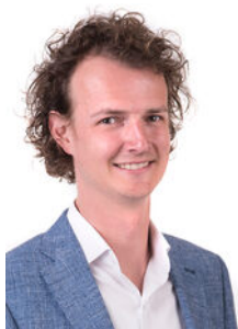
Joost Haman Makelaar o.z.

Als lokale experts kennen wij de regio Leiden van binnen en buiten. U kunt bij ons terecht voor al uw vragen en advies met betrekking tot onroerend goed. Wij zijn een servicegerichte organisatie en ondersteunen u bij elke stap van het transactieproces. Van tips om uw huis verkoopklaar te maken tot aan het verzorgen van een naamplaatje voor de nieuwe eigenaar van uw woning. Onze beroemde slogan luidt: "Niemand in de wereld verkoopt meer onroerend goed dan RE/MAX." Laat ons u overtuigen.