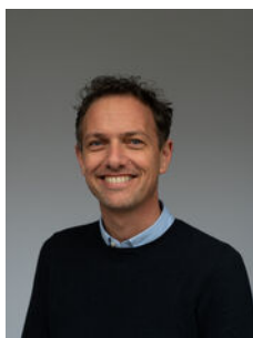
Jimmy van Delft Makelaar

Als lokale experts kennen wij de regio Leiden van binnen en buiten. U kunt bij ons terecht voor al uw vragen en advies met betrekking tot onroerend goed. Wij zijn een servicegerichte organisatie en ondersteunen u bij elke stap van het transactieproces. Van tips om uw huis verkoopklaar te maken tot aan het verzorgen van een naamplaatje voor de nieuwe eigenaar van uw woning. Onze beroemde slogan luidt: "Niemand in de wereld verkoopt meer onroerend goed dan RE/MAX." Laat ons u overtuigen.