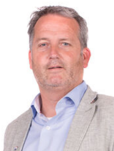
Andre Bunnig Makelaar o.z.

Als lokale experts kennen wij de regio Leiden van binnen en buiten. U kunt bij ons terecht voor al uw vragen en advies met betrekking tot onroerend goed. Wij zijn een servicegerichte organisatie en ondersteunen u bij elke stap van het transactieproces. Van tips om uw huis verkoopklaar te maken tot aan het verzorgen van een naamplaatje voor de nieuwe eigenaar van uw woning. Onze beroemde slogan luidt: "Niemand in de wereld verkoopt meer onroerend goed dan RE/MAX." Laat ons u overtuigen.